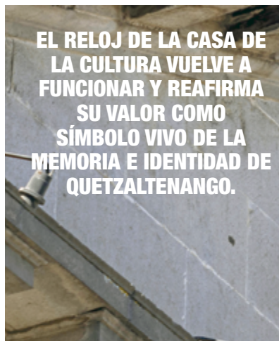
EL RELOJ DE LA CASA DE LA CULTURA VUELVE A FUNCIONAR Y REAFIRMA SU VALOR COMO SÍMBOLO VIVO DE LA MEMORIA E IDENTIDAD DE QUETZALTENANGO.

“Es parte de mi vida”, afirma el relojero. Desde hace casi 14 años