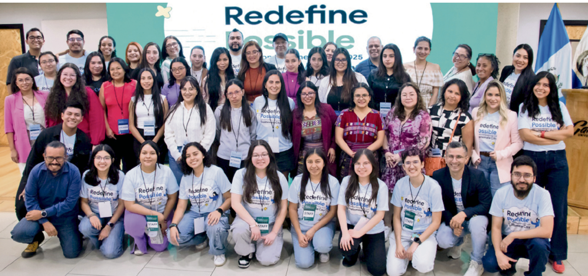
El evento IWD convoca a mujeres jóvenes para escuchar a expertas en diversos temas.