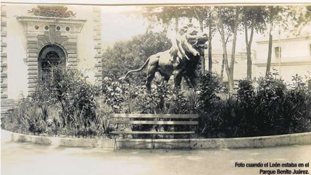
Foto cuando el León estaba en el Parque Benito Juárez.

Algunos desfiles patrios, con el paso de los años, se continuaron realizando desde dicho templos, o en ocasiones finalizando o pasando frente a ellos.