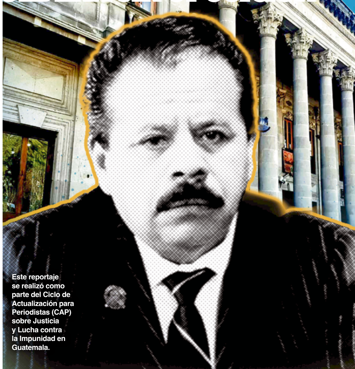
Este reportaje se realizó como parte del Ciclo de Actualización para Periodistas (CAP) sobre Justicia y Lucha contra la Impunidad en Guatemala.