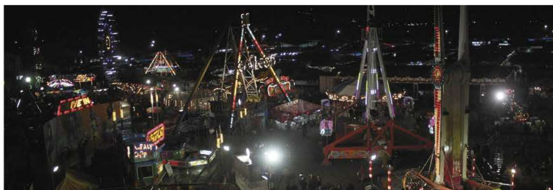
1. En segundo lugar la municipalidad de Momostenango con un Q1 millón 56 mil. Albino Cuyuch, del partido Cabal, se estrenó en el puesto de alcalde con un festejo de 16 días.